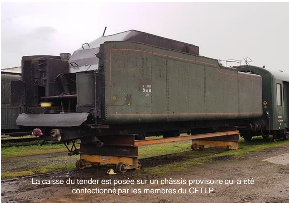
La caisse du tender est posée sur un châssis provisoire qui a été confectionné par les membres du CFTLP

Le voilà sur ses nouvelles roues ..... provisoires !!!!