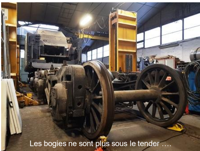
Les bogies ne sont plus sous le tender ....