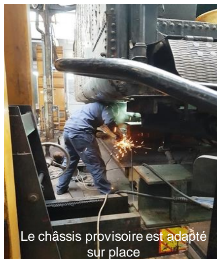
Le châssis provisoire est adapté sur place

Pour faire un don: www.fondation-patrimoine.org/62947 www.trainvapeur.com